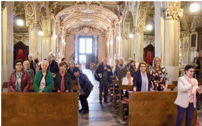
Pellegrinaggio Sacro Monte

La Santa Messa dedicata alla benedizione e al rinnovo delle promesse matrimoniali è stata celebrata Sabato, 1 Settembre alle ore 17.00 a Kilchberg. Tutte le coppie che festeggiano un anniversario e desiderano partecipare alla celebrazione, possono prenotarsi presso la segreteria della Missione al numero 044 725 30 95. A seguito della funzione verrà